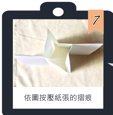
依圖按壓紙張的摺痕