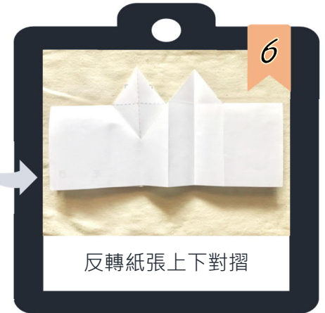
反轉紙張上下對摺