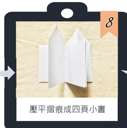
壓平摺痕成四頁小書