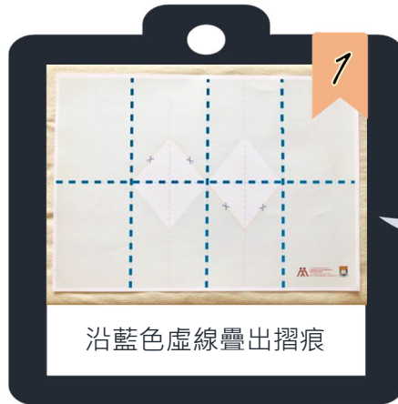
沿藍色虛線疊出摺痕

除了向熟悉的人分享你的故事外，有沒有想過向陌生人也說說你的故事，藉此向他們傳播愛和關懷呢？😊